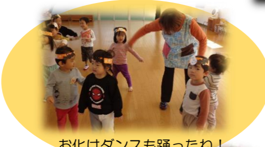
お化けダンスも踊ったね！