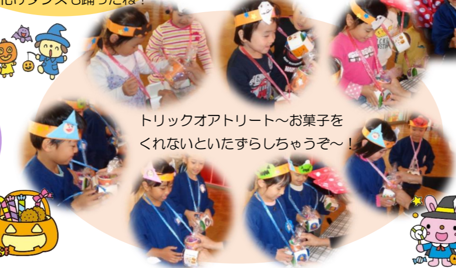
トリックオアトリート～お菓子を くれないといたずらしちゃうぞ～！