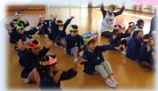
ハッピーバースデーの歌のプレゼント おめでとう～☆☆