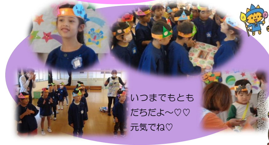
いつまでもともだちだよ～♡♡ 元気でね♡