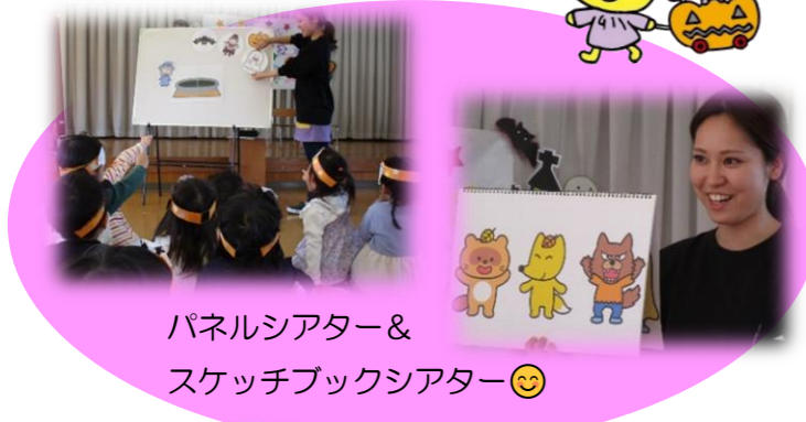
パネルシアター& スケッチブックシアター😊